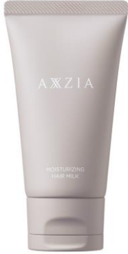
アクシージア モイスチャライジングヘアミルク

新ブランドのローンチ、および新商品の発売を記念して特別なキャンペーンを、先行発売日 2024年11月22日(金)より実施いたします。「メデュラックス コーム アイロン」をご購入いただいた先着300名のお客様に、アクシージア独自レシピのヘアミルクをプレゼントいたします。ヘアミルクには、ヒートリペア成分*6を配合。スタイリングの前に使用することで、熱のちからを味方に傷んだ髪を補修してくれます。