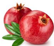
ザクロ果実エキス