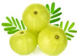
アムラ果実エキス

マンゴスチンエキスとともに12種のサポート成分を厳選配合。これまでご好評をいただいている「AGドリンクX」のキー成分であるトウビシエキスを中心とした9種の成分はそのままに、新たに3つの成分*7を加え、うるおいのある健やかな毎日をサポートします。