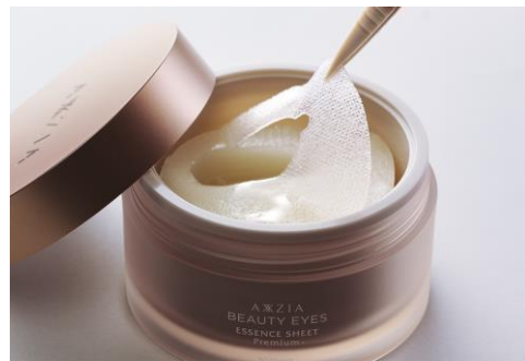
<目元用シート> 60枚入り 9,900円(税込)

大人の目もと悩み“ハリ不足”や“乾燥くすみ”は目もとに影を落とし、暗い印象を与えがちです。「エッセンスシートプレミアムプラス」は、そんな目もとに、「トリプルミネラルコンプレックス*2」に加えて、ビタミンKを含んだ複数のオイルを新配合しました。まぶた～目尻～目の下～頬の三角ゾーンまで、目まわり全体を覆うアクシージアオリジナル形状のままに、美容液をたっぷり90mLに増量。アイシートにしかないみずみずしさを肌の奥まで届け*3、目まわりの徹底エイジングケア*4を叶えます。