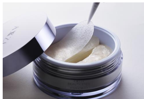
<目元用シート> 60枚入り 7,040円(税込)

目もとの肌にハリとツヤを与えてくれる成分「バチルス発酵物」と、ボタニカルエキスを新配合。目もと悩みにさらに徹底的にアプローチする処方になりました。目の下にパッと貼るだけで、目もとケアが完了。さらにシンプルな形状のシートは、口もとの気になる部分へのポイントケアにもご使用いただけます。マルチに活躍する「エッセンスシートプラス」は、初めての目もとケアにおすすめのアイテムです。