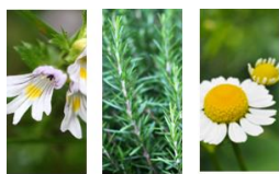
植物サポート成分*5